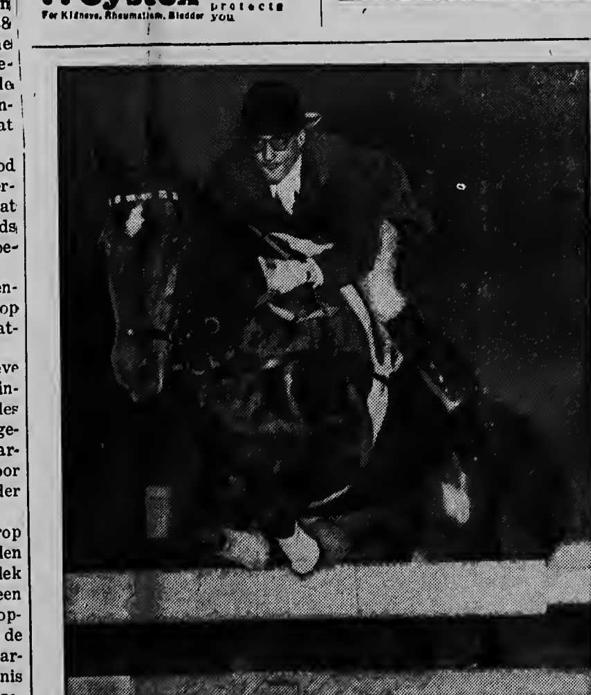
HANS WINKLER, 26, a German aspirin manufacturer, guides his mount, Hella, over a jump on his way to winning the Royce A. Drake Memorial Challenge Trophy at the National Horse Show, Madison Square Garden, New York. Germans, competing in the horse show for the first time in 24 years, have been riding away with most of the honors.